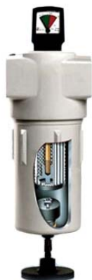
Filtro de Aire Ultra Compacto SERIE QAD - W