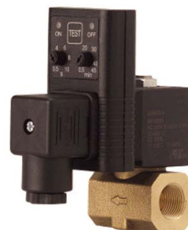
Drenaje Automático con Timmer ACCESORIOS

Nunca mas Agua - Humedad - Aceite - Partículas