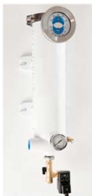
Secadores de Aire Industriales SERIE QAD - L