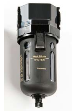
Secador-Filtro de Aire SERIE QAD - B