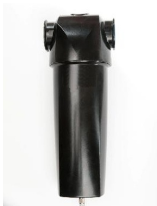
Separador de Agua SERIE QAD - S

Contáctese con nuestro Departamento de Ventas por más información sobre nuestros Productos y Accesorios