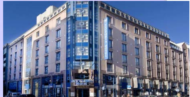
Instalación de 2 Sistemas en Hotel Victoria (cadena Rica Hotels – Oslo)

Una relación directa entre la mala calidad del agua y el muy mal rendimiento en el sistema de climatización fue la conclusión de la gerencia en este hotel después varios años de observación e investigación. Con el C4S se logra combinar un excelente tratamiento contra la corrosión y contaminación en todos los circuitos de climatización, junto con una filtración superior. La conclusión después de 2 años de uso es plenamente positiva, con agua transparente, sistemas y circuitos limpios sin corrosión, mantenciones mínimo sin usar químicos, con ahorros energéticos significativos en el rango de 14%.