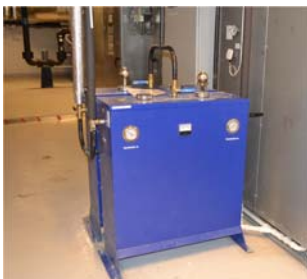
2 x C4S-5 en el subterráneo del Hotel tratando el agua del HVAC

El C4S es una alternativa muy superior al tratamiento (dosificación) de productos químicos y se puede adaptar facilmente para tratar los sistemas de calefacción y refrigeración de circulación cerrado, que combina la filtración continua, acondicionamiento de agua, bajos costos de funcionamiento y mantenimiento de un régimen confiable estructurado.